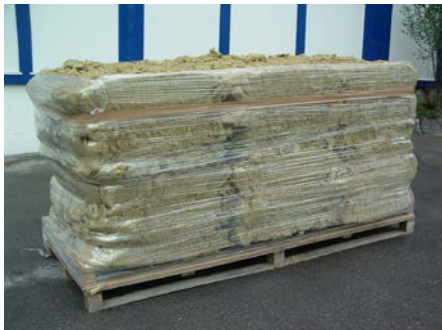
Lana di roccia Flumroc sciolta su pallet monouso

nel sacco di riciclaggio imballata con film termoretraibile su pallet monouso Flumroc o compressa in balle ritiro di camion interi su richiesta