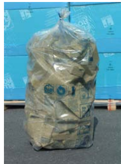
Lana di roccia Flumroc sciolta in un sacco di riciclaggio

Non vengono accettate forniture in imballaggi di cartone, sacchi della nettezza urbana, in sacchi di carta o di altro genere.