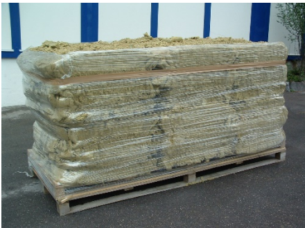
Lana di roccia Flumroc sciolta su pallet monouso