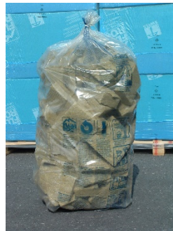
Lana di roccia Flumroc sciolta in un sacco di riciclaggio

Non vengono accettate forniture in imballaggi di cartone, sacchi della nettezza urbana, in sacchi di carta o di altro genere.